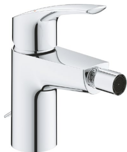
marca GROHE serie Eurosmart