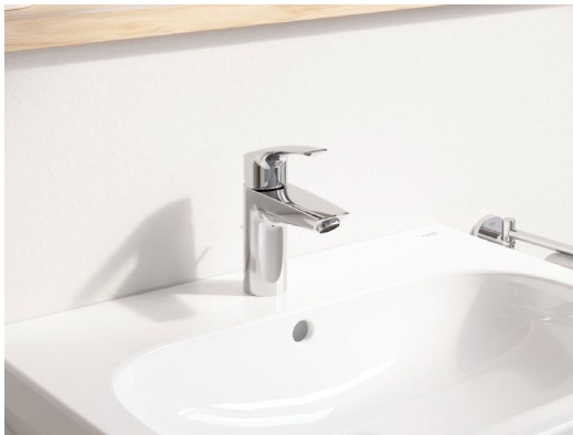
marca GROHE serie Eurosmart